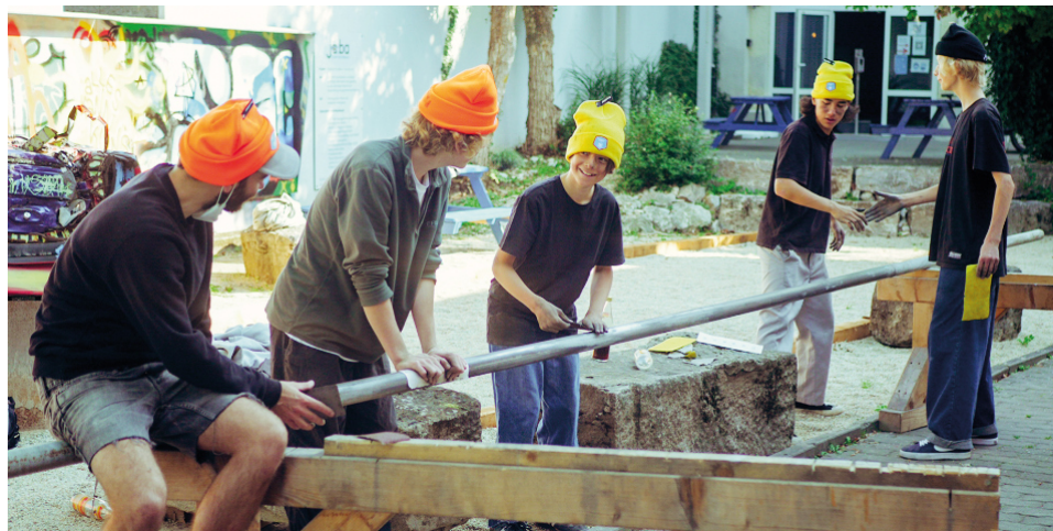
Jugendliche bei der Feinarbeit für Skatehallenelemente