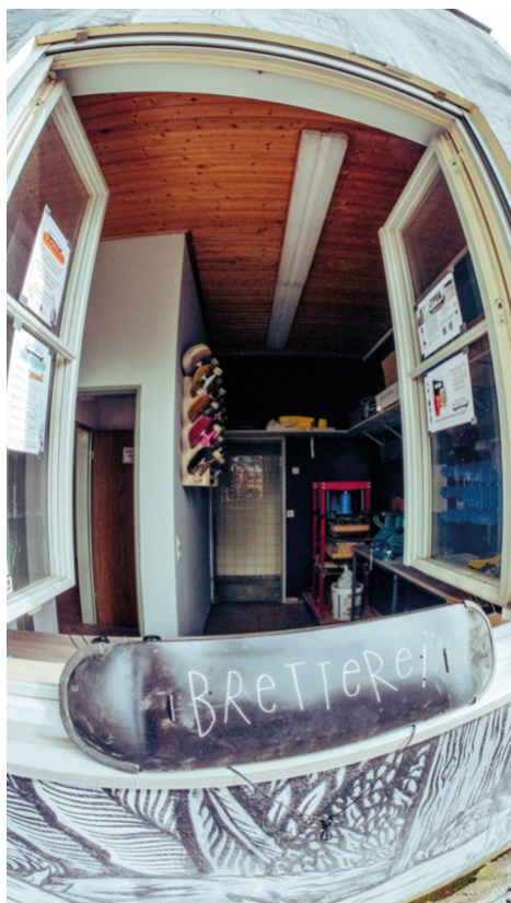
Verleihfenster zu Coronazeiten